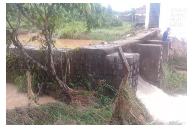
Rompimento da Estação elevatória – Bairro Alice Batista